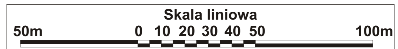
WYRYS ZE STUDIUM UWARUNKOWAŃ I KIERUNKÓW ZAGOSPODAROWANIA PRZESTRZENNEGO GMINY NOWY ŻMIGRÓD SKALA 1:10 000