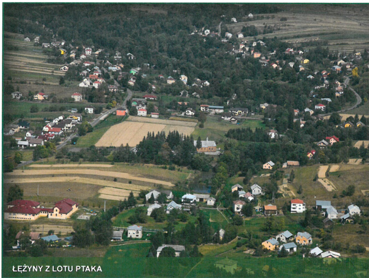
ŁĘŻYNY Z LOTU PTAKA