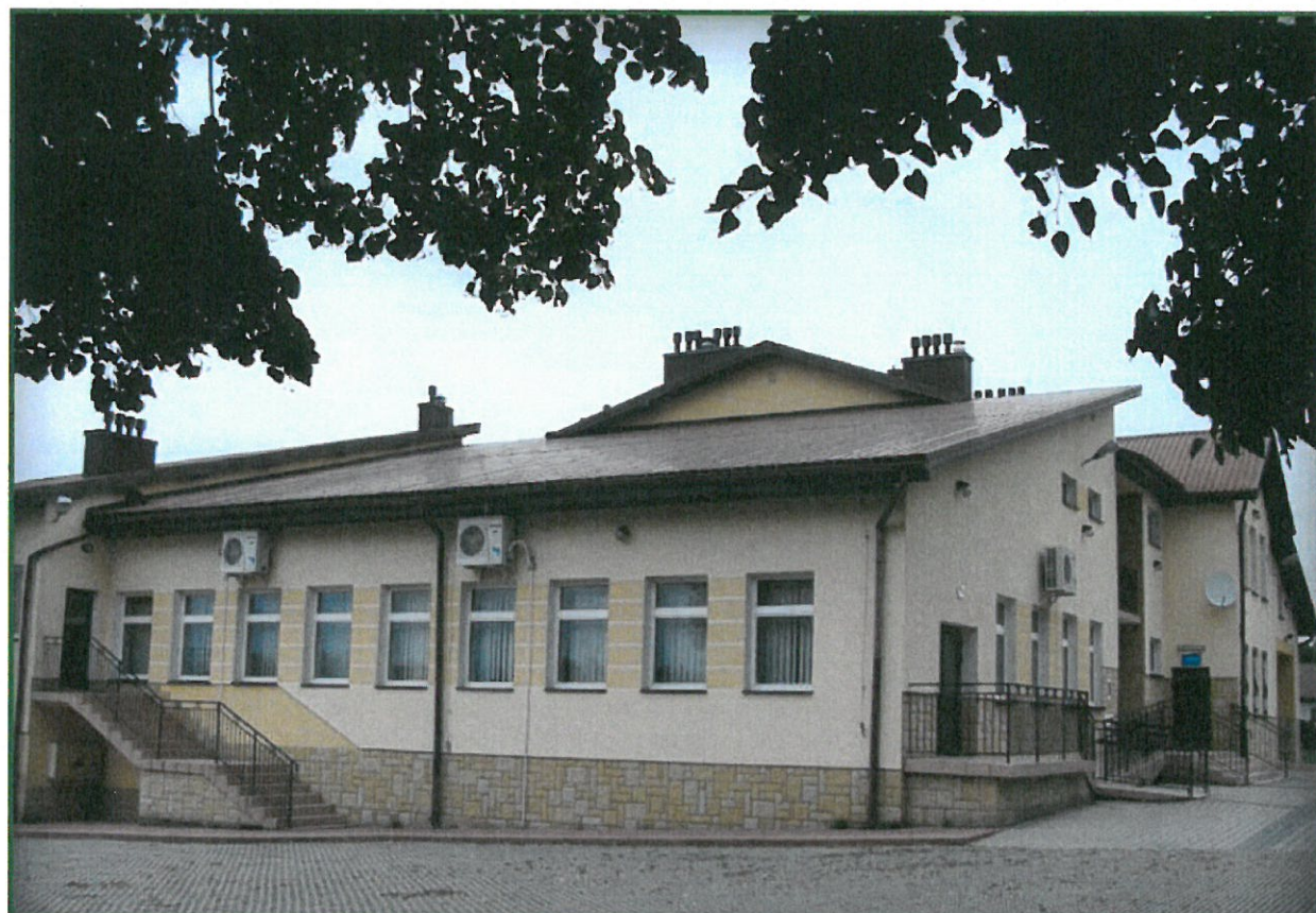
DOM LUDOWY, OSP